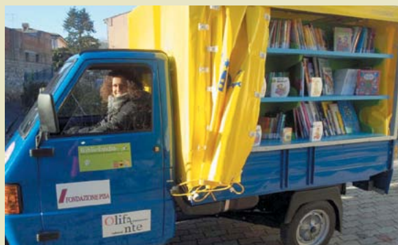
BiblioApe in movimento

Da questa situazione nasce il progetto Bancarella dei libri usati di Bibliolandia. Tra gli obiettivi c'è quello di prolungare la vita dei libri, di non lasciarli nel buio di cantine e soffitte, di consegnare loro una seconda vita e di cercare di estrarne valore da reinvestire in cultura.